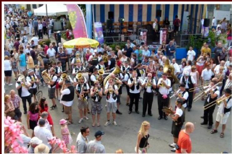
25 Joer Roepoepers zu Maacher 2012